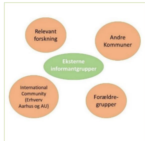
Figur 3: Inddragelse af eksterne informantgrupper

Samlet set er 11 dagtilbud og 27 skoler udpeget til deltagelse i undersøgelsen i form af fokusgruppeinterviews. I udpegningen er der taget højde for kvantitative faktorer som elevsammensætning og geografisk placering.