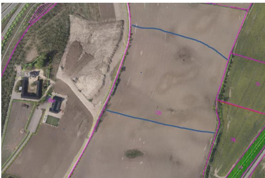
Fig. 1. Det godkendte opfyldningsområde er på ca. 40.000 m 2 og markeret med blå steger mod syd og nord på matriklen og af matrikelskel mod øst og vest.