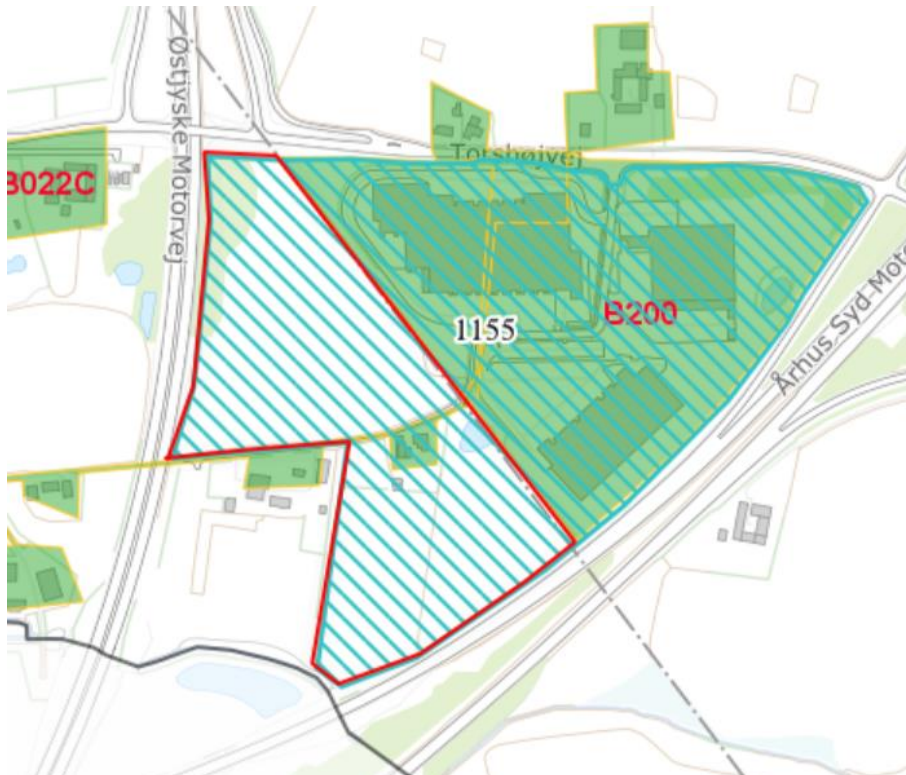
Figur 1 - Afgrænsning af det nye kloakopland (rød) og eksisterende kloakopland B200 (grøn udfyldning). Lokalplanområdet nr. 1155 er markeret med blå skravering

Der er udarbejdet en samlet regnvandshåndteringsplan for hele lokalplansområdet.