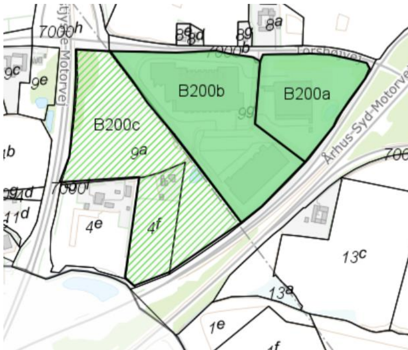
Figur 2 - Det eksisterende kloakopland B200 opdeles i to; B200a og B200b. Det nye kloakopland navngives B200c (skravering).

For fremadrettet at tydeliggøre hvilke oplande der leder til hvilke bassiner og udløb, opdeles det eksisterende kloakopland i to områder, og navngives B200a og B200b, som vist på figur 2. Det nye kloakopland navngives B200c (figur 2).