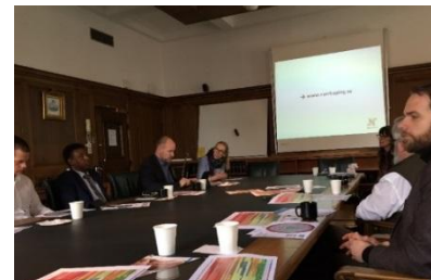
Der fortælles om arbejdet med tidlige indsatser i Norrköping Kommune

SkolFAM –teamet består af en kontaktperson, en psykolog og en specialpædagog, der koordinerer arbejdet omkring det enkelte barn med henblik på at styrke barnets faglighed og sociale bånd i skolen. Disse faktorer er nemlig afgørende for, at barnet lykkes og kan skabe de bedste forudsætninger for det fremadrettede liv.