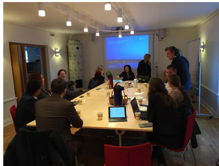
Oplæg hos Socialforvaltningen i Stockholm Kommune

I Socialforvaltningen i Stockholm Stad havde man gennem en længere periode haft fokus på samarbejdet med pårørende, herunder særligt forældre til børn med handicap. I den forbindelse har man sat fokus på at skabe en god relation til de pårørende gennem tillid og anerkendelse. Modellen tager udgangspunkt i Axel Honneths tanker om netop erkendelse og anerkendelse og har vist sig nyttig i samarbejdet mellem Socialforvaltningen og de pårørende. I Aarhus Kommune har man ligeledes sat fokus på samarbejdet med de pårørende med forskellige tiltag, hvormed der var mulighed for at drøfte og vidensudveksle på tværs af landegrænser.