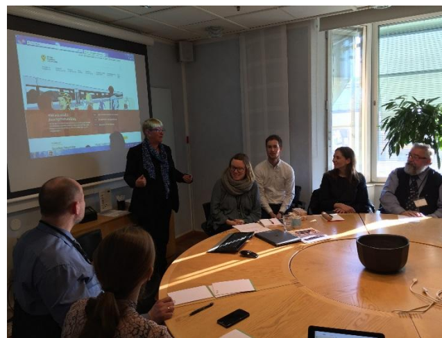
Dialog med SKL

På baggrund af den ovenstående model har flere kommuner sat fokus på og igangsat konkrete initiativer med fokus på tidlig indsats. Socialudvalget var på turens anden dag i Norrköping Kommune for at se, hvordan netop denne kommune arbejder med tidlige indsatser og besøge konkrete projekter.