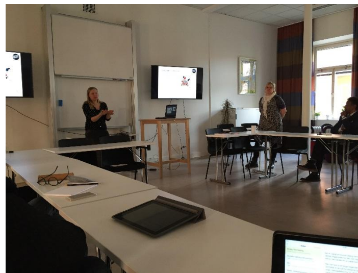
To medarbejdere fra Projektet Alla Barn i Skolan fortæller om indsatsen

På skolen har der altid været fokus på fravær men med projektet er tingene blevet sat i system. Alle skoler arbejder således inden for den samme ramme og der er en guide til, hvordan fravær mv. skal registreres. Der er således en kontaktlærer for alle klasser, der forestår registreringen af fraværet, som følges løbende. Såfremt at et fravær bliver problematisk er der mulighed for at igangsætte flere initiativer såsom hjemmebesøg, kontakt via SMS, støtte i undervisningen, undervisning i et andet miljø, tilpasset/begrænset skolegang. Det er i denne sammenhæng vigtigt med fleksibilitet og relationer i arbejdet med elevernes fravær.