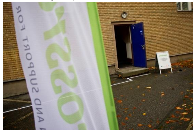
Foran indgangen hos Crossroads

Udover at rådgive borgere om forholdene i Sverige, har man også fokus på de strukturelle udfordringer, der kan være i forbindelse med håndteringen af migranter i Sverige. Blandt andet har man fokus på muligheden for at få CPR - nummer i Sverige. Her er udfordringen, at man for at få et CPR - nummer skal bevise, at man skal have ophold i mere end et år. Dette kan være svært, da målgruppen ofte har kortvarige kontrakter og dermed er det svært at få adgang til de offentlige ydelser, selv om man egentligt er berettiget til dem. En anden udfordring er sagsbehandlingstiden på opholds- og arbejdstilladelser, der udfordrer den frie bevægelighed og samtidigt udgør en stor psykisk belastning for de personer, som har ansøgt om ophold i landet.