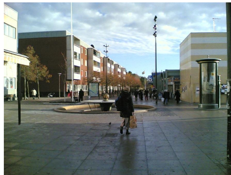
Billede fra gå-gaden i Tensta

sprog. Det er således muligt i de fleste tilfælde, at få rådgivning på sit modersmål. Med henblik på at klarlægge effekten af projektet er Stockholms Universitet ligeledes en del af projektet.